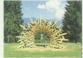
Arte Sella Borgo Valsugana (Tn) - da marzo