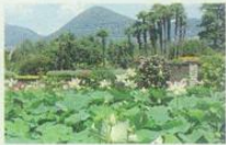
Giardini Botanici di Villa Taranto Verbania-Pallanza (Vb) - dal 15 marzo