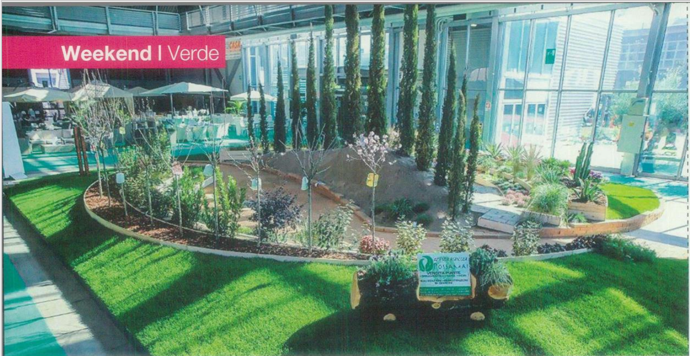
In alto, Ortogiardino , l'evento fieristico di Pordenone ; a destra, Giardini d'Autore nella città di Rimini e la rassegna di giardinaggio Fiori nella Rocca a Brescia

al 15 ottobre - i giardini si riempiono di animazioni, giochi e fiabe, concerti di musica barocca, classica e moderna, performance artistiche e spettacoli. E se con tutto questo parlare di piante e giardini vi è venuta la febbre da "pollice verde", si ha tempo fino al 12 marzo per fare un salto a Ortogiardino , l'evento fieristico di Pordenone dedicato ai giardinieri professionisti e agli appassionati di giardinaggio. Valgono poi una sosta anche il Parco Federico Fellini nella città di Rimini - che dal 17 al 19 marzo si fa location di Giardini d'Autore , l'ormai riconosciuta mostra di giardinaggio che accoglie i migliori vivaisti italiani -, e la raffinata rassegna di giardinaggio Fiori nella Rocca che dal 7 al 9 aprile è ospitata nella cornice della quattrocentesca Rocca di Lonato del Garda a Brescia : un tuffo nel verde tra piante rare, abbigliamento in canapa e giochi per bambini. Tra le novità di quest'anno, poi, il 21 aprile apre a Giarre , in Sicilia , la prima edizione del Garden Festival del Mediterraneo : il primo evento internazionale dedicato al garden design e all'architettura del paesaggio del Mediterraneo, che vede coinvolti giovani designer, istituzioni, imprese e grandi protagonisti del paesaggismo, dell'arte e dell'architettura.