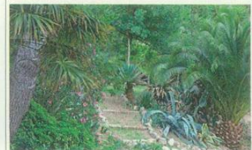
Il Giardino del Biviere Lentini (Sr) - da marzo