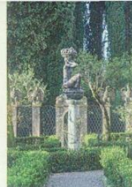
Il Vittoriale degli Italiani Gardone Riviera (Bs) - da marzo l'orario estivo