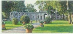
Villa Visconti Borromeo Litta Lainate (Mi) - dal 1 maggio