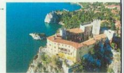
Castello di Duino Duino-Aurisina (Ts) - da aprile