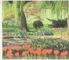
Parco Giardino Sigurtà Valeggio sul Mincio (Vr) - dal 5 marzo