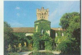
Castello di San Pelagio Due Carrare (Pd) - da marzo