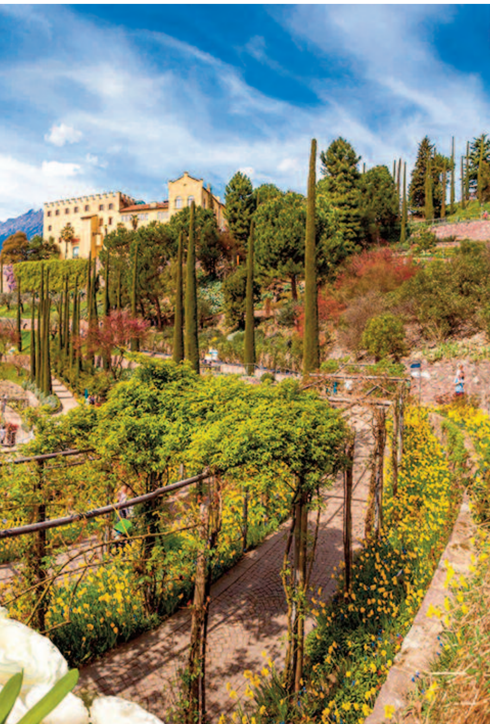
Giardini di Sissi - Merano

Da un capo all'altro della penisola, con qualche puntata in Europa e una lontanissima digressione a Tahiti, tutte le più belle occasioni alla ricerca di colori e profumi