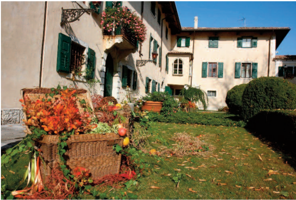
Castello di Strassoldo